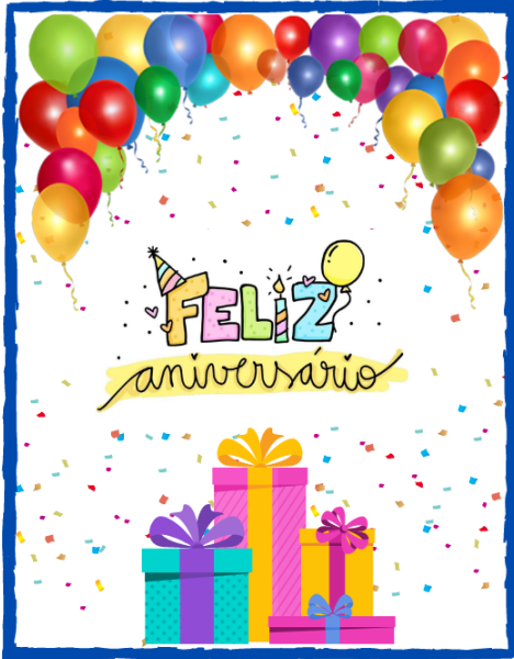
Capa do Cartão