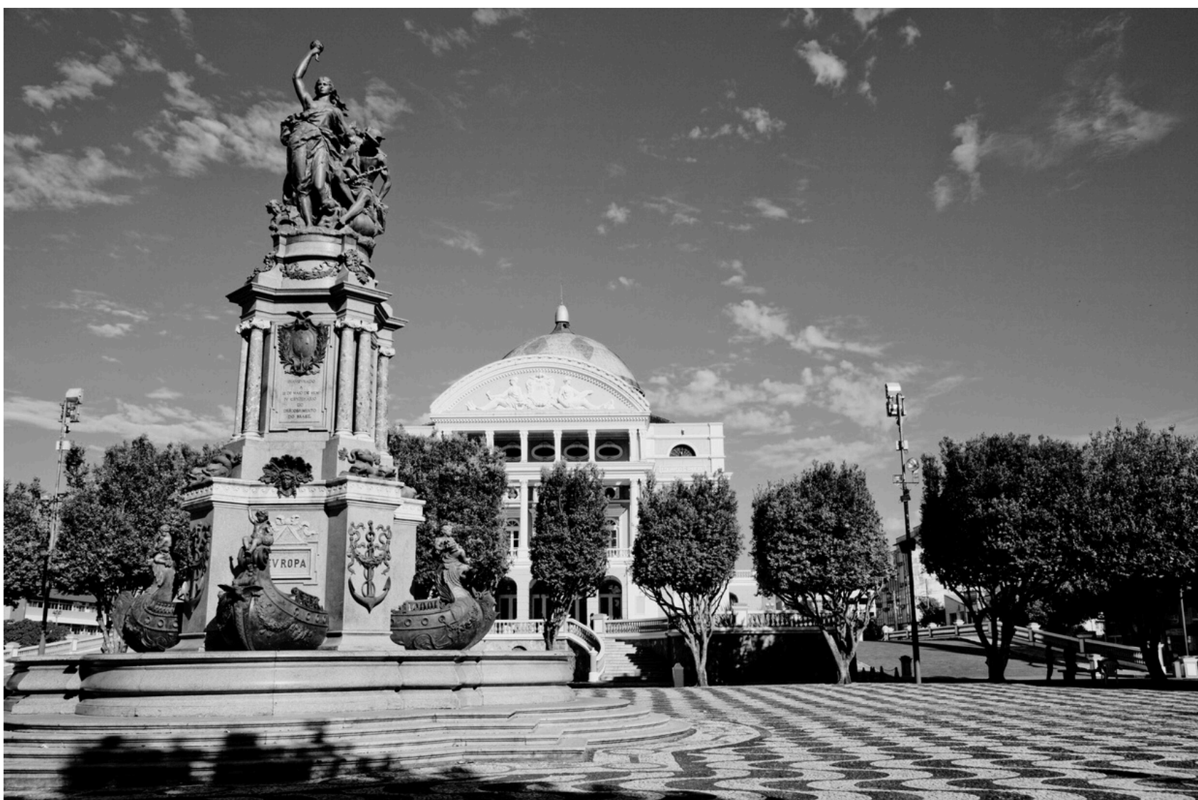
O Monumento à Abertura dos Portos às Nações Amigas é um importante marco histórico situado no Largo de São Sebastião, em frente ao imponente Teatro Amazonas, no centro de Manaus. Sua primeira versão, um obelisco mais simples, foi inaugurada em 1867. Contudo, o monumento que conhecemos hoje foi erguido em 1899 e inaugurado no ano de 1900. Ele celebra a abertura dos rios da Amazônia para o comércio internacional, ocorrida em 1866, simbolizando a integração da região com o mercado global durante o ciclo da borracha.

5:Monumentos são símbolos colocados em praças para que ninguém esqueça de um fato ou pessoa. Veja este exemplo de monumento histórico: