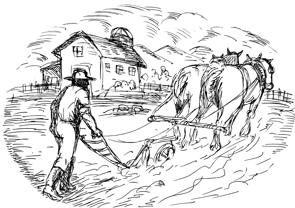
A: Um agricultor usando um arado puxado por bois.

4: Observe as duas imagens abaixo que mostram o preparo da terra para o plantio: