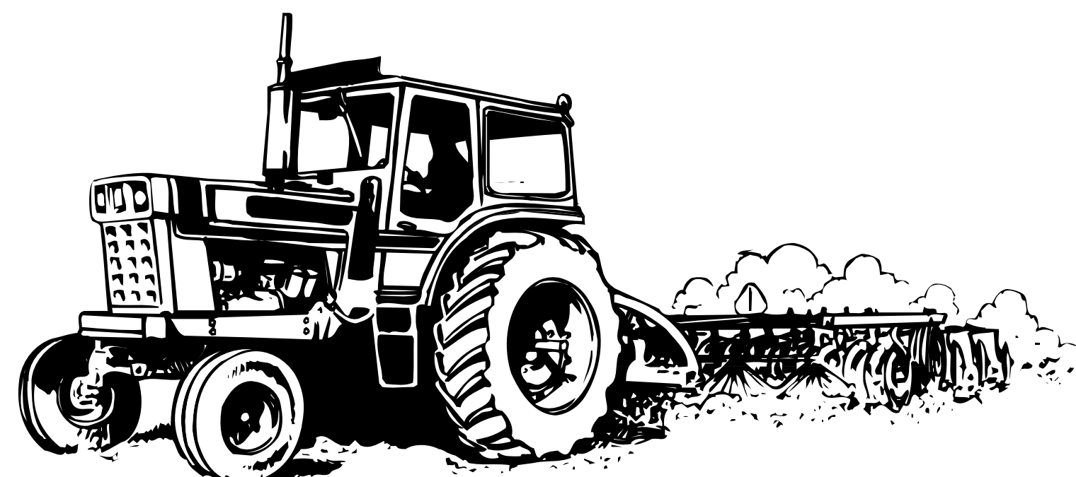
B: Um agricultor dirigindo um trator com GPS.