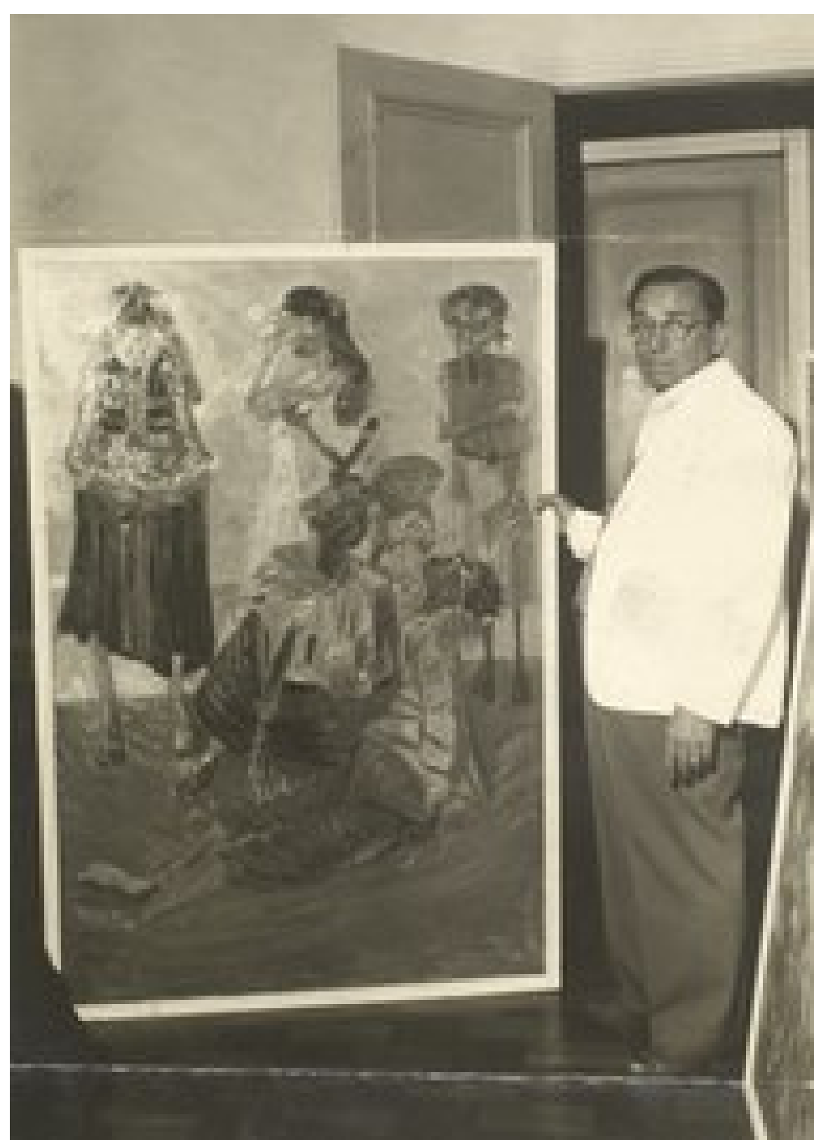
Portinari em 1958

Eu queria ser lembrado como o artista que pintou a alma do Brasil. Lembre-se sempre: não importa de onde você vem, seus sonhos podem levar você a lugares que você nem imagina!