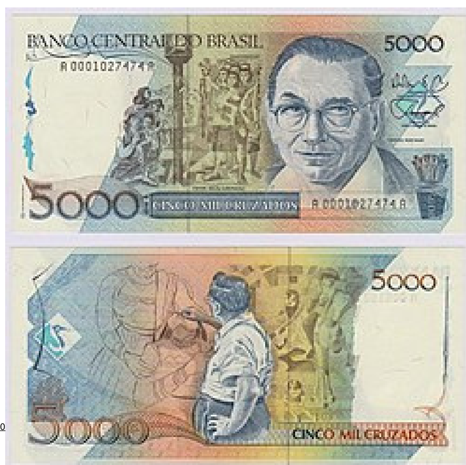
Portinari e suas obras representados na cédula de 5000 Cruzados, que circulou no Brasil entre 1986 e 1989