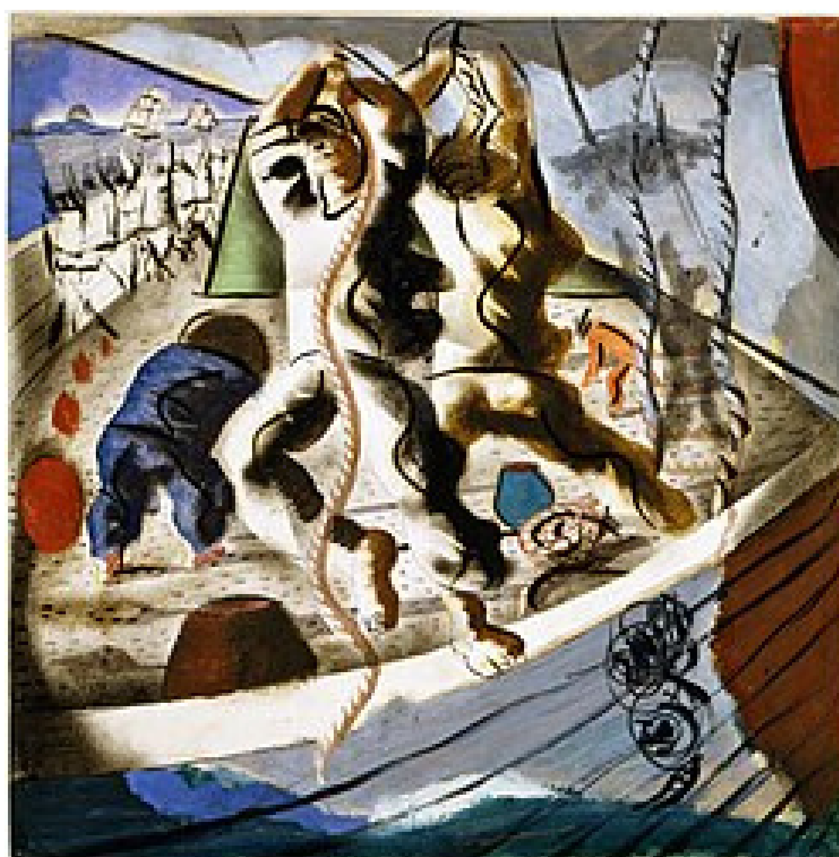
A descoberta da terra, 1941. Pintura mural de Portinari no edifício da Biblioteca do Congresso, Washington, DC. FONTE: https://pt.wikipedia.org/wiki/Candido_Portinari

Infelizmente, as tintas que eu tanto amava acabaram me deixando doente. Naquela época, elas tinham muito chumbo, o que me causou um problema de saúde grave. Mesmo proibido pelos médicos de pintar, eu não conseguia parar — a arte era a minha vida.