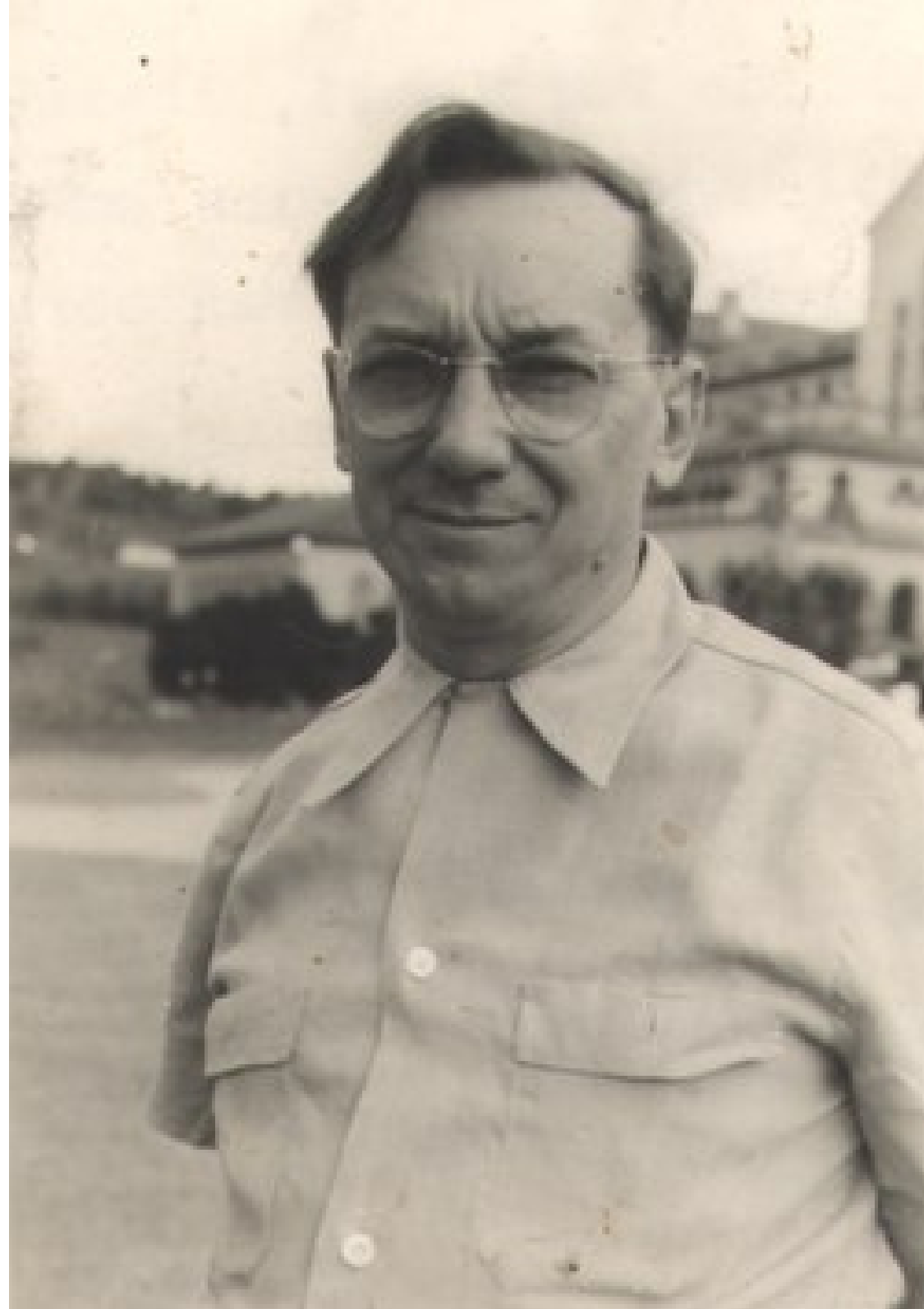
OCandido Portinari em 1962

Olá! Eu sou Cândido Torquato Portinari, mas a maioria das pessoas me conhece apenas como Portinari. Vou contar um pouco da minha história para vocês, que começou em um lugar cheio de terra roxa e pés de café.