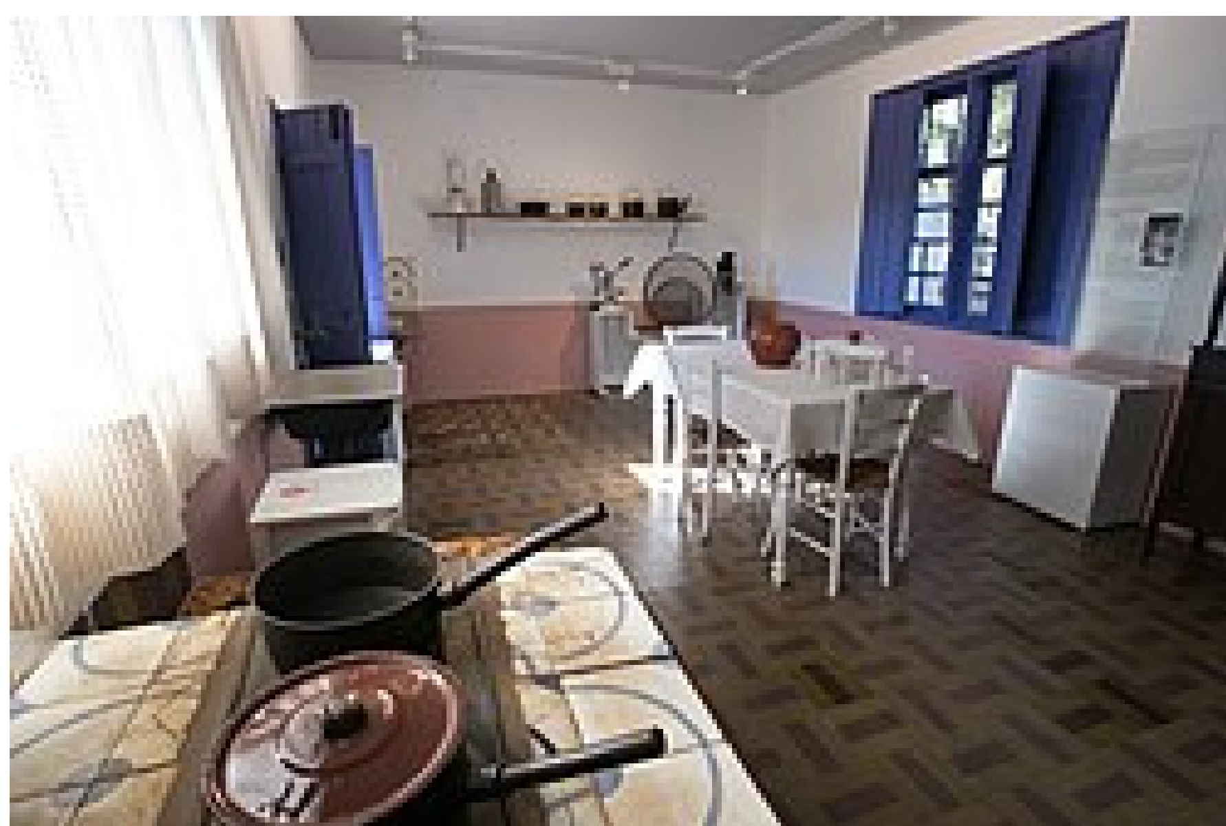
Interior da casa onde Portinari morou em Brodowski, atual Museu Casa de Portinari.

Em 1928, ganhei um prêmio muito importante: uma viagem para a Europa! Morei em Paris por dois anos. Lá, aprendi técnicas modernas, mas senti uma saudade imensa do Brasil. Foi longe de casa que percebi o que eu realmente queria pintar: o meu povo, a minha terra e a realidade dos brasileiros.