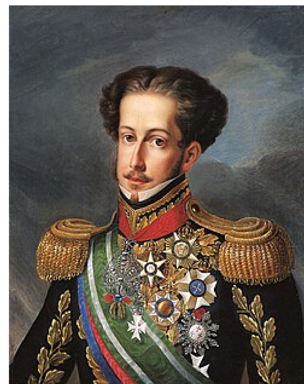
Imagem de Dom Pedro I

Nasci no Palácio de Queluz, perto de Lisboa, em Portugal, no dia 12 de outubro de 1798. Sou filho do Rei Dom João VI e da Rainha Carlota Joaquina. Desde cedo, eu estava destinado a grandes responsabilidades, mas a minha vida mudou muito quando eu era criança.