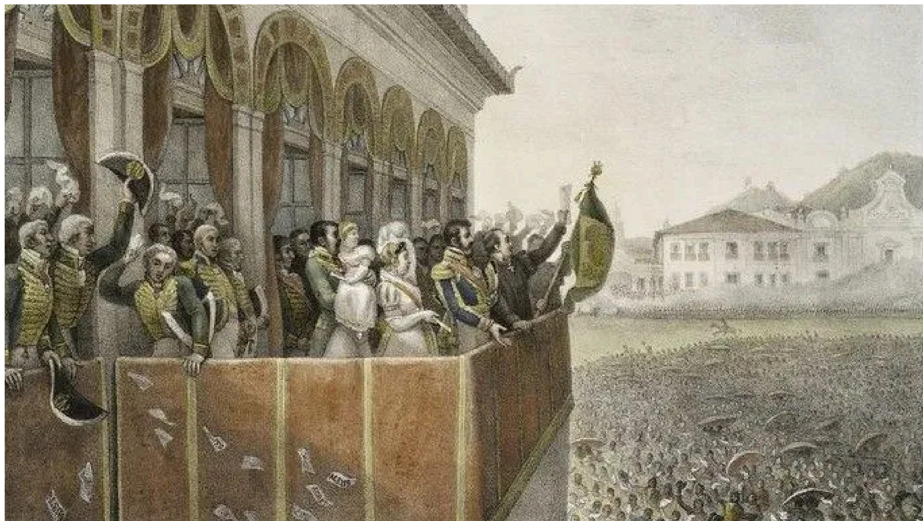
Dia do Fico, 200 anos

Foi assim que o Brasil se tornou um país livre e independente de Portugal. Fui aclamado o primeiro Imperador do Brasil e passei a ser conhecido como Dom Pedro I.