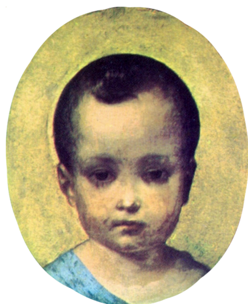
Pedro II aos 10 meses de idade, 1826

Minha educação foi levada muito a sério. Eu adorava ler e estudar! Tive muitos professores que me ensinaram sobre ciências, línguas, história e arte. Eu falava várias línguas e tinha uma enorme curiosidade pelo conhecimento.