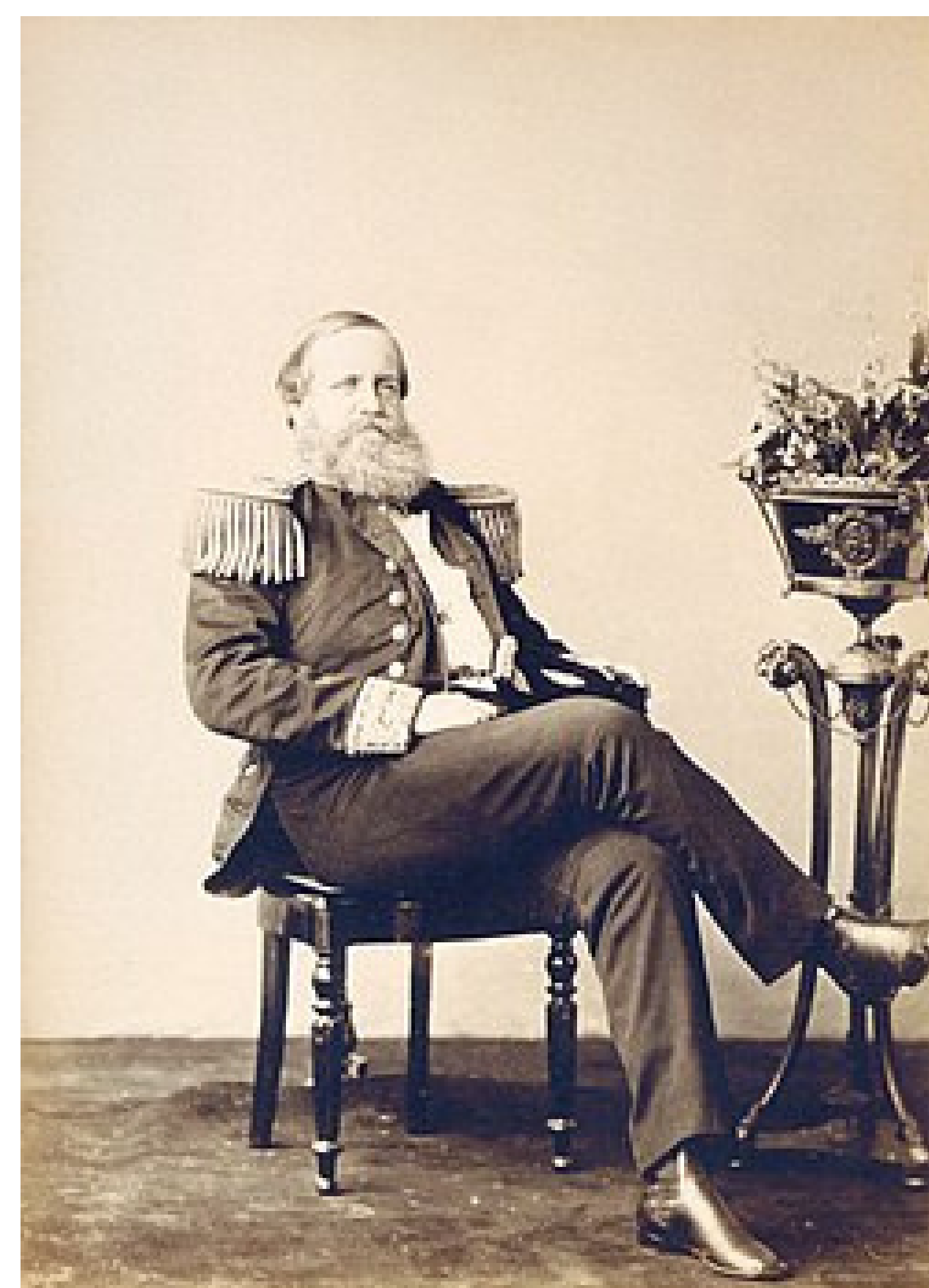
Vestido com o uniforme de almirante aos 44 anos de idade, os anos de guerra envelheceram prematuramente o imperador

Fui obrigado a deixar o Brasil e fui para o exílio (morar fora do país) na Europa. Morri em Paris, na França, em 1891, sentindo muita saudade da minha pátria. Fui um imperador que amava a ciência, a educação e, acima de tudo, o povo brasileiro.