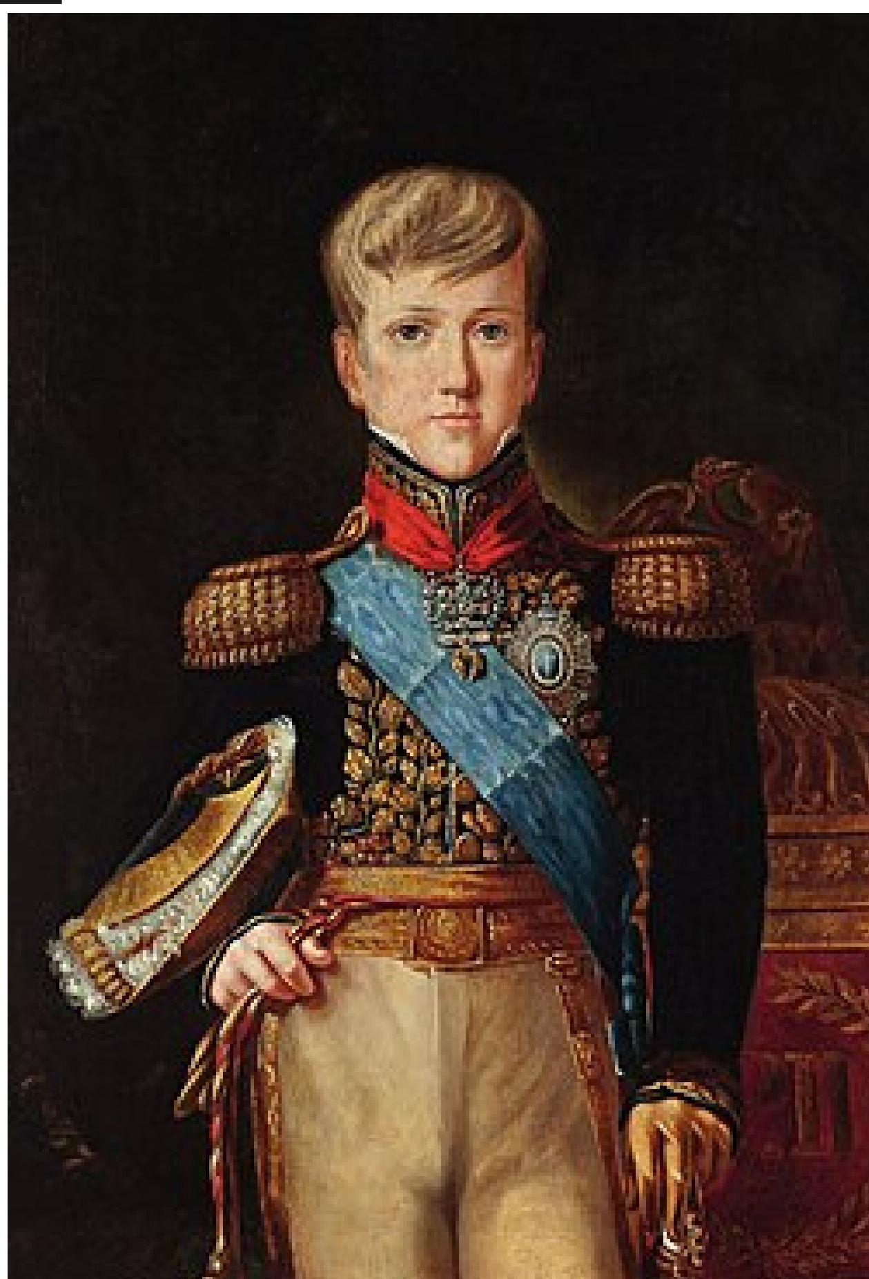
O imperador Pedro II aos 12 anos de idade vestindo o uniforme imperial de gala, 1838, por Félix Émile Taunay, no Museu Imperial