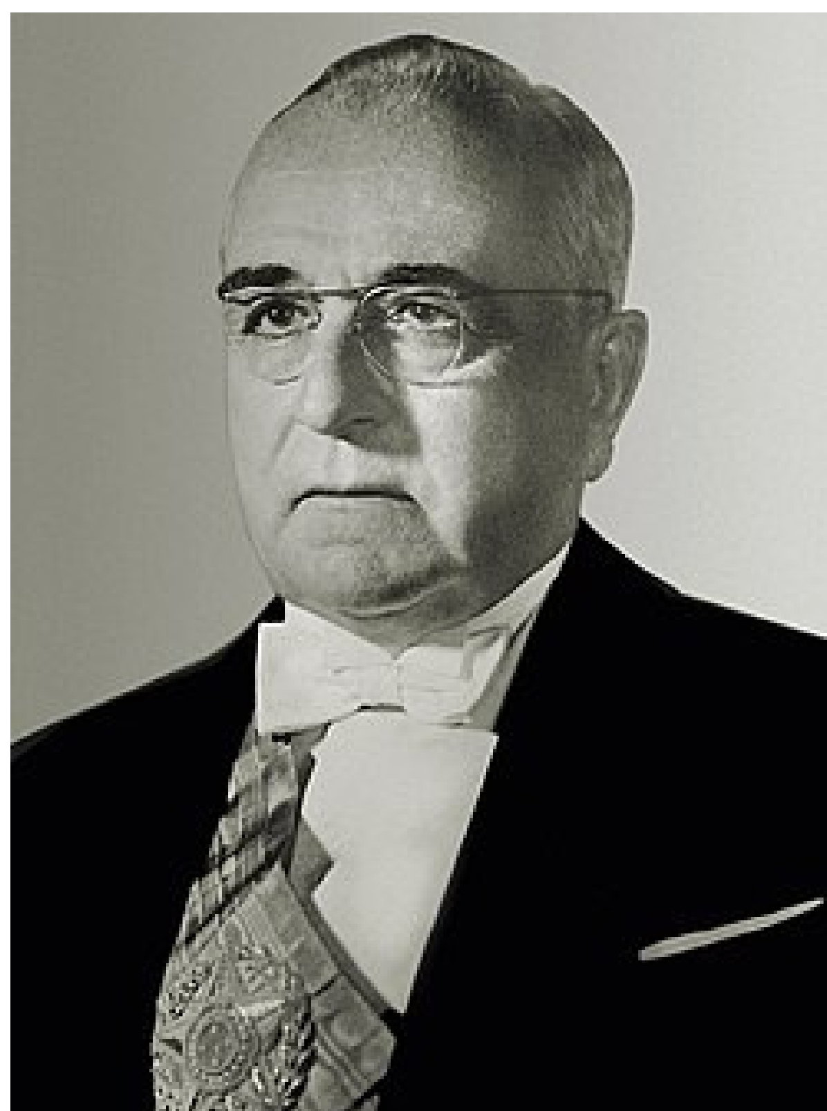
Getúlio Vargas, Foto oficial do segundo mandato.

Minha história mostra como o Brasil mudou muito no século passado. Espero que tenham gostado de conhecer um pouco mais sobre o que eu fiz pelo nosso país!