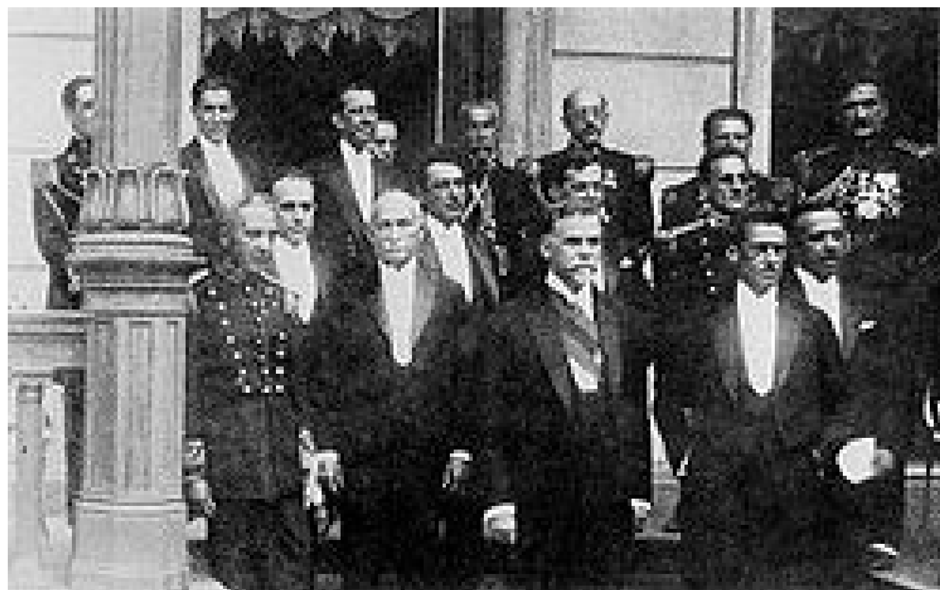
Getúlio (o primeiro à esquerda, na fileira do meio) é empossado ministro da Fazenda no governo de Washington Luís, em 1926.

Essas empresas ajudaram o Brasil a ter suas próprias fábricas e a crescer economicamente.