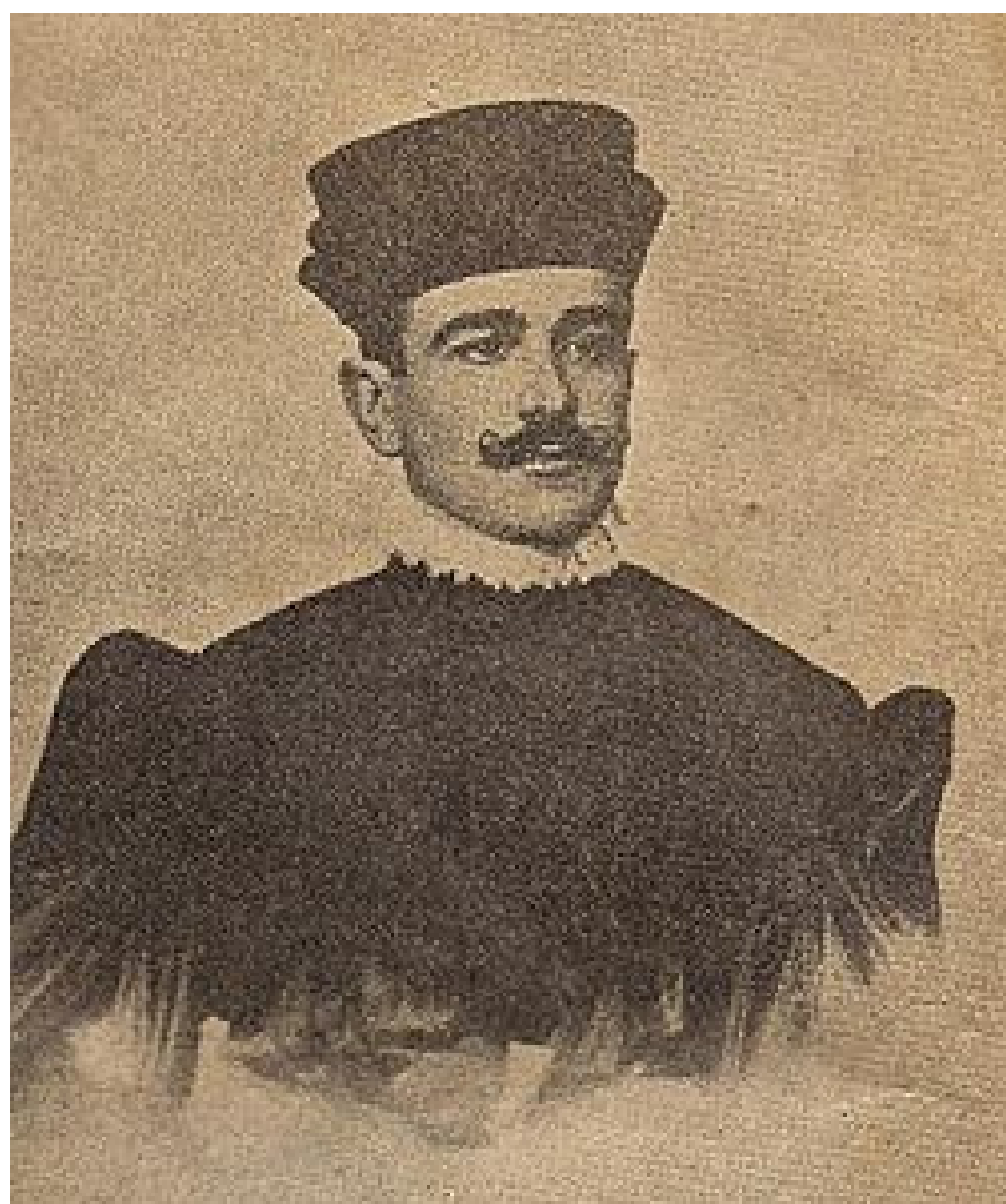
Getúlio formando-se em direito, ano de 1907