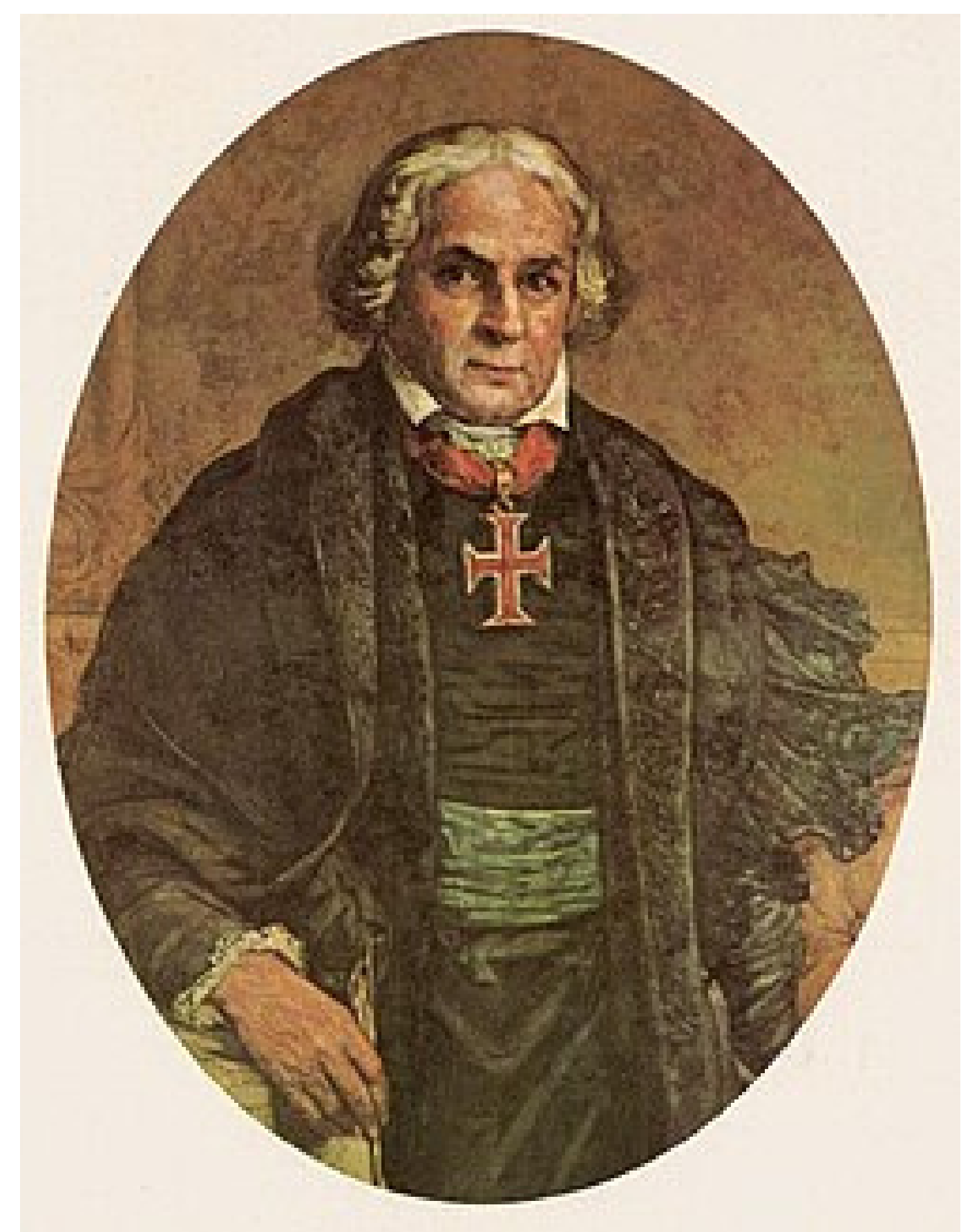
José Bonifácio, por Oscar Pereira da Silva.

No dia 7 de Setembro de 1822, Dom Pedro atendeu ao meu chamado e declarou a Independência do Brasil!