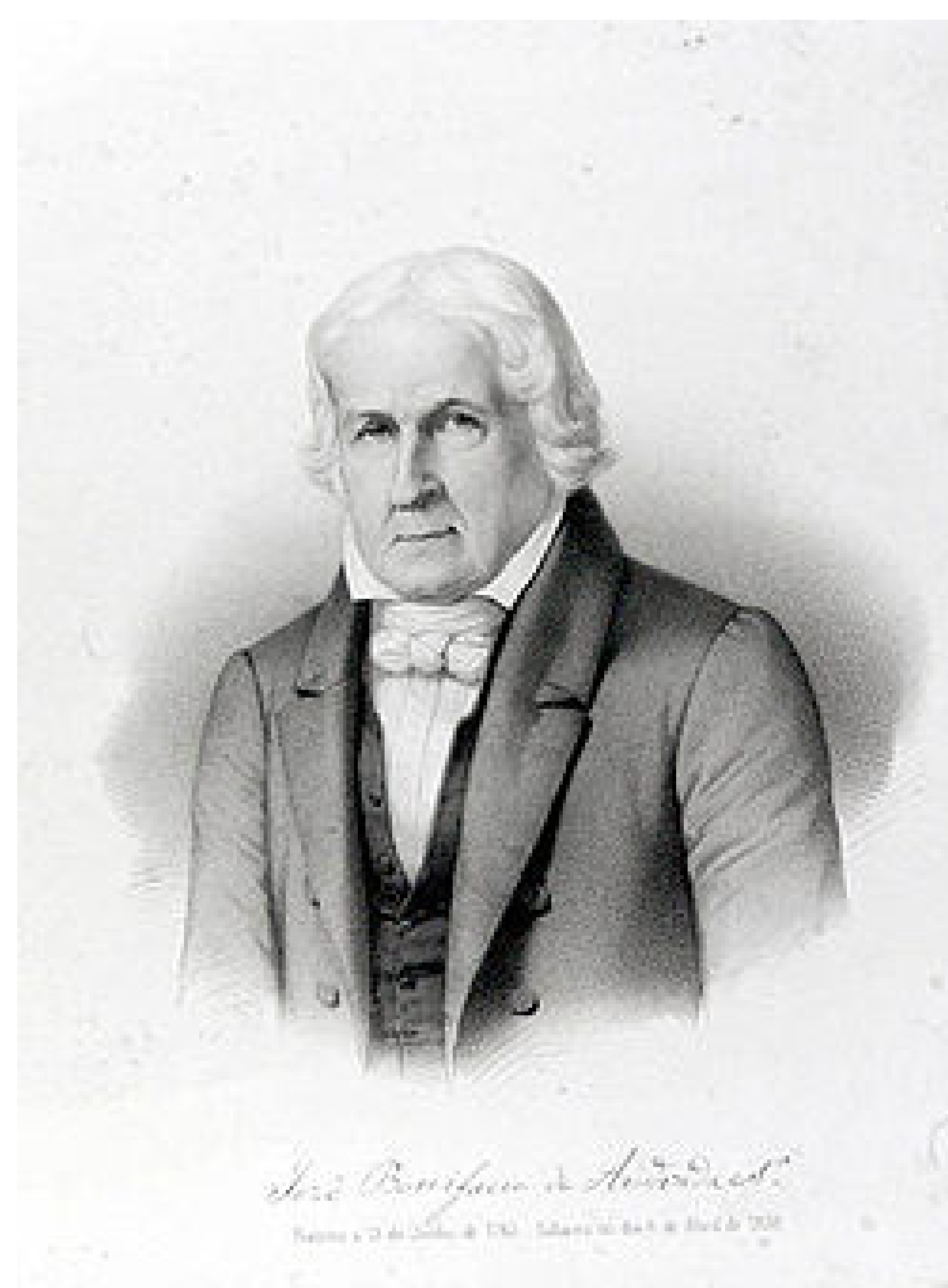
Gravura de José Bonifácio