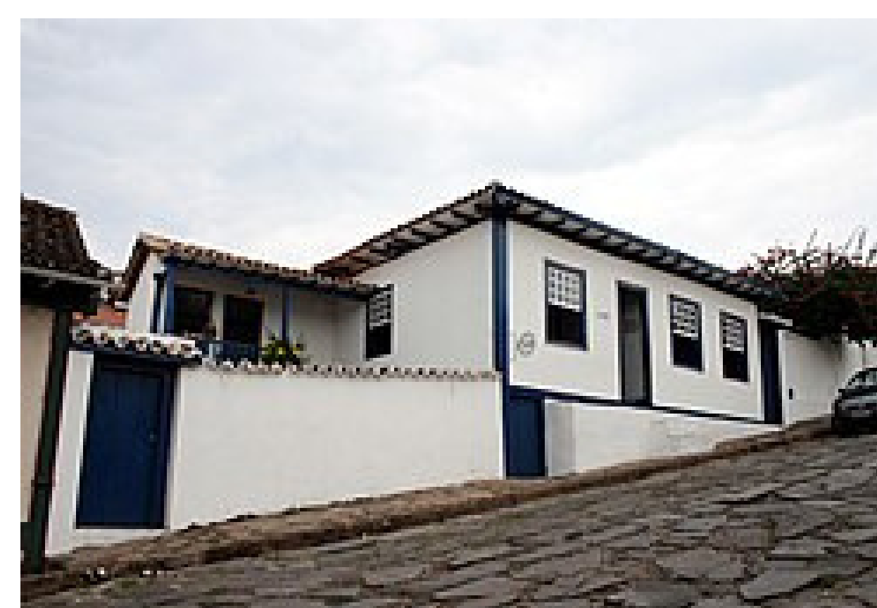
Residência de Juscelino dos três aos dezenove anos, localizada em Diamantina, na Rua São Francisco, número 241. Atualmente, é um museu.

Minha entrada na política foi quase por acaso, quando um amigo me convidou para ser Chefe de Gabinete (o braço direito) do interventor de Minas Gerais, Benedito Valadares, em 1933. Gostei da experiência e, a partir daí, minha carreira deslanchou.