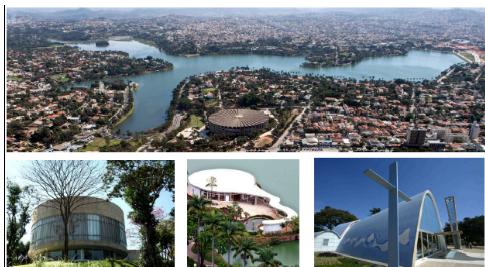
Conjunto Arquitetônico da Pampulha FONTE: https://www.qconcursos.com/questoes-militares/questoes/cf11b9b9-de

Fui prefeito de Belo Horizonte (a capital de Minas Gerais). Nessa época, comecei a mostrar meu talento para construir coisas grandes e modernas, como o famoso Conjunto Arquitetônico da Pampulha, com o arquiteto Oscar Niemeyer, depois de prefeito fui governador de Minas Gerais.