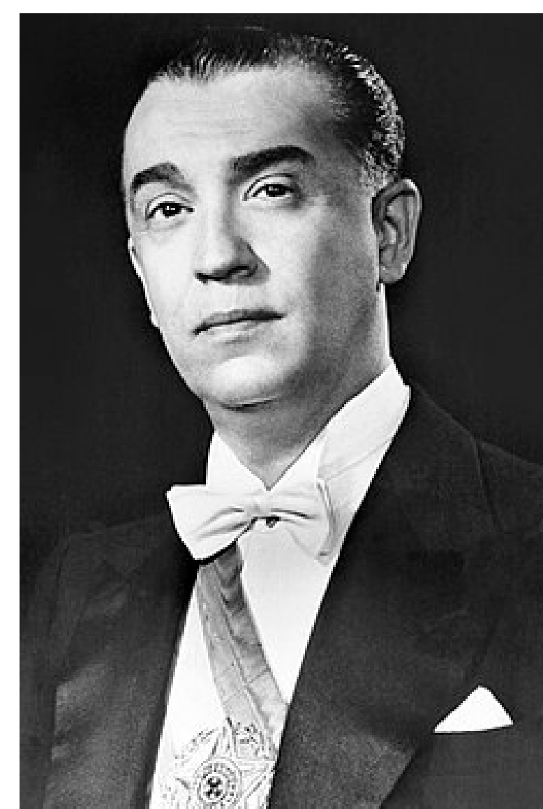
Juscelino Kubitschek, Retrato oficial, 1956

Eu fui um médico e político muito importante na história do Brasil. Nasci em 12 de setembro de 1902, na cidade de Diamantina, em Minas Gerais.