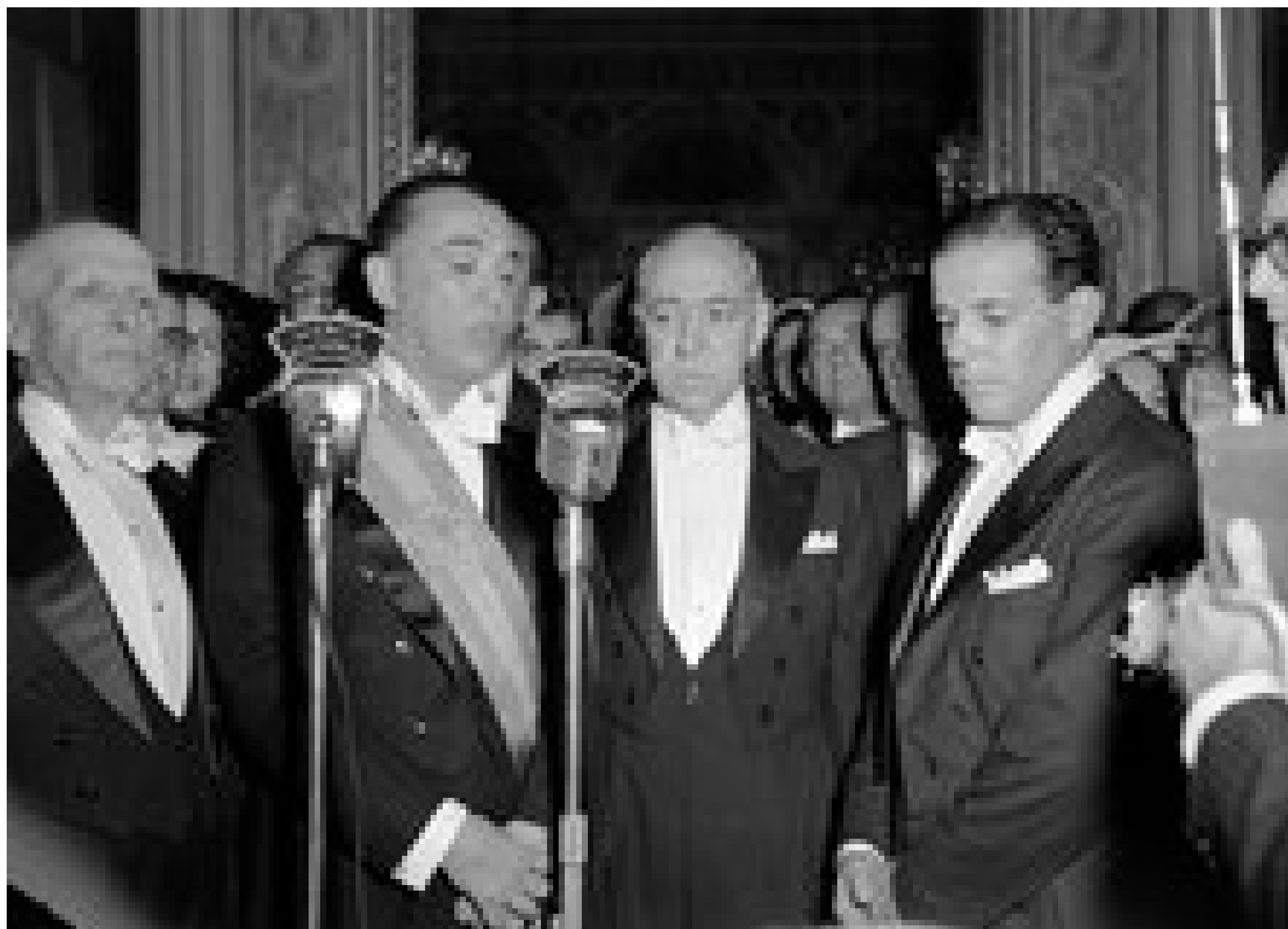
Posse de Juscelino Kubitschek como Presidente da República e de João Goulart como Vice, 1956.

Minha vida foi dedicada a construir e desenvolver o Brasil. Queria deixar um país mais moderno, industrializado e cheio de estradas. Espero que as crianças de hoje continuem a ver em Brasília um sinal de que, quando se tem um grande sonho, é possível realizá-lo!