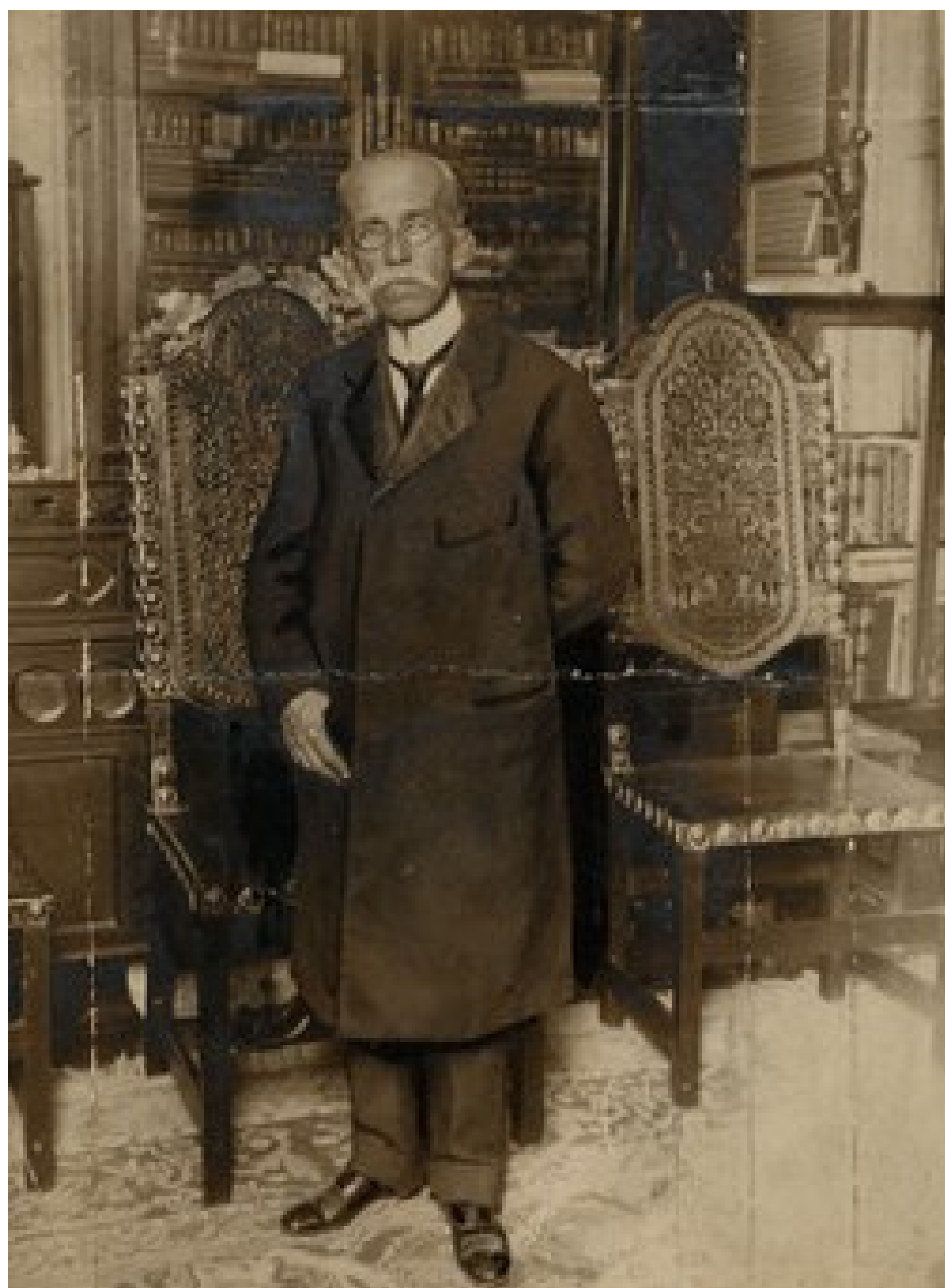
Rui Barbosa em sua biblioteca...

Por causa do meu desempenho nessa conferência, onde defendi a justiça com tanta garra, ganhei o famoso apelido de "Águia de Haia".