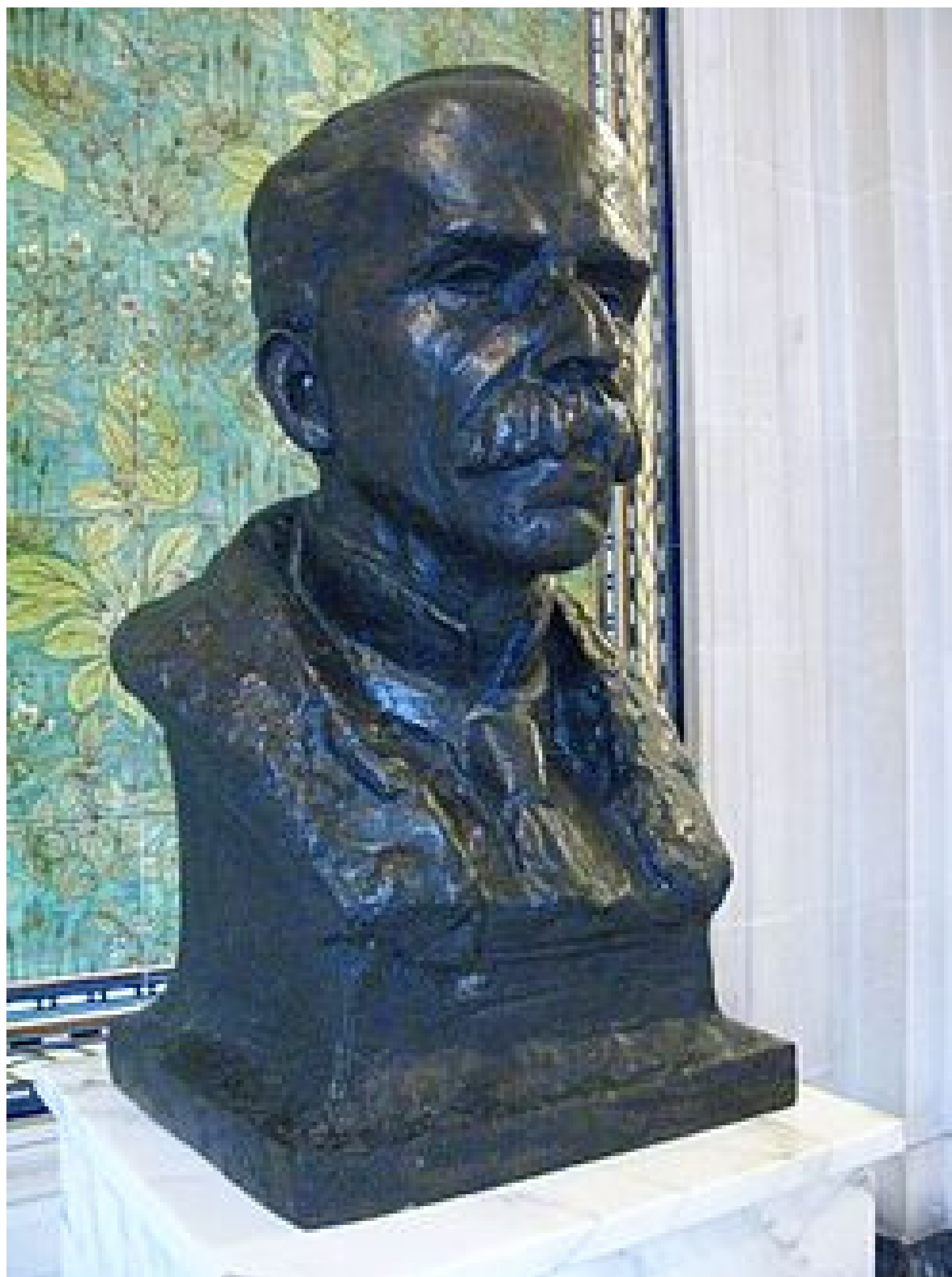
Busto de Rui Barbosa no Palácio da Paz, em Haia

Se você vir alguém citando uma frase muito inteligente sobre liberdade ou justiça, pode ser que ela seja minha! Lembrem-se: a lei e a educação são a base de qualquer nação forte!